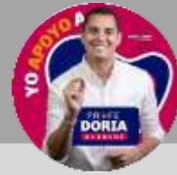
Dumek Turbay Paz