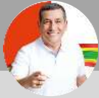
Dumek Turbay Paz