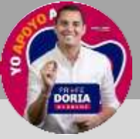
Dumek Turbay Paz