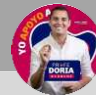
Dumek Turbay Paz