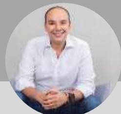
HORACIO JOSÉ SERPA