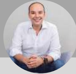
HORACIO JOSÉ SERPA