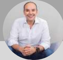
HORACIO JOSÉ SERPA