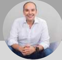
HORACIO JOSÉ SERPA