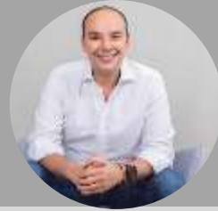
HORACIO JOSÉ SERPA