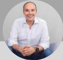
HORACIO JOSÉ SERPA

*Limitar lugares estratégicos de la ciudad como los céntricos, históricos para autos, y entregarlo a las personas a pie, en bicicleta.