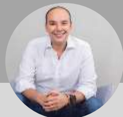
HORACIO JOSÉ SERPA