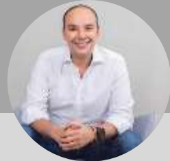
HORACIO JOSÉ SERPA