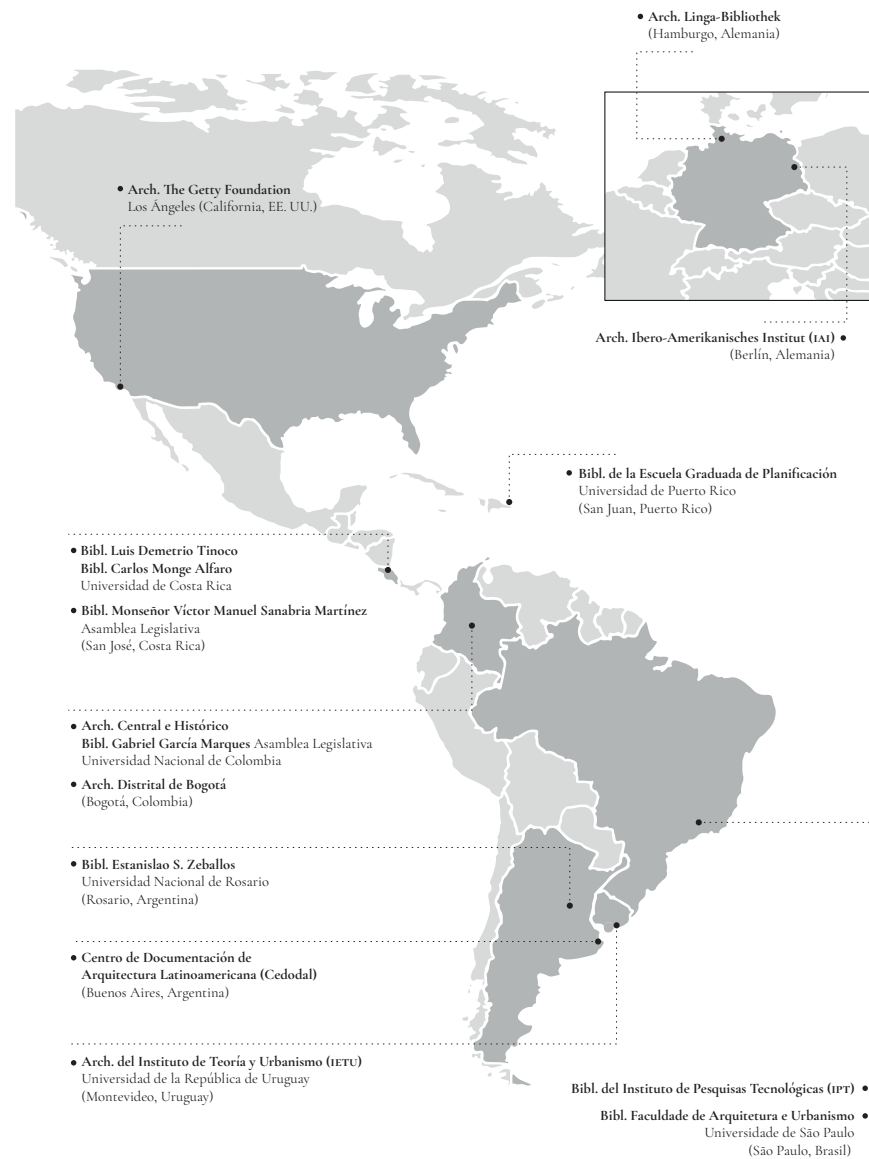
Figura 1.1 Bibliotecas y archivos consultados para la investigación